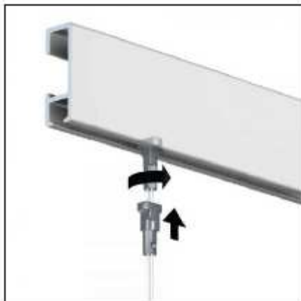
Nástěnný závěsný systém / barva ELOX

Ve výběrovém řízení je definována položka ZS1 a ZS2.